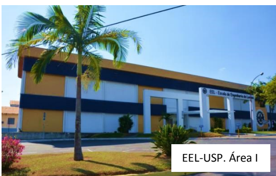
EEL-USP. Área I

Em 2012 passou a oferecer novos cursos de graduação: Engenharia Ambiental, Engenharia Física e Engenharia de Produção. Em 2014 foi criado o mestrado profissional em Projetos Educacionais de Ciências. Em 2017 passou a oferecer também o doutorado em Engenharia Química.