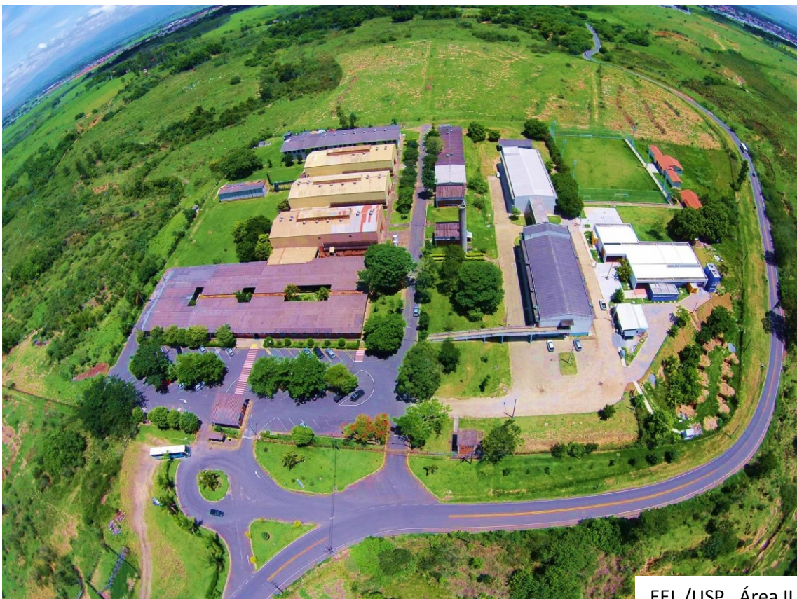
EEL /USP. Área II