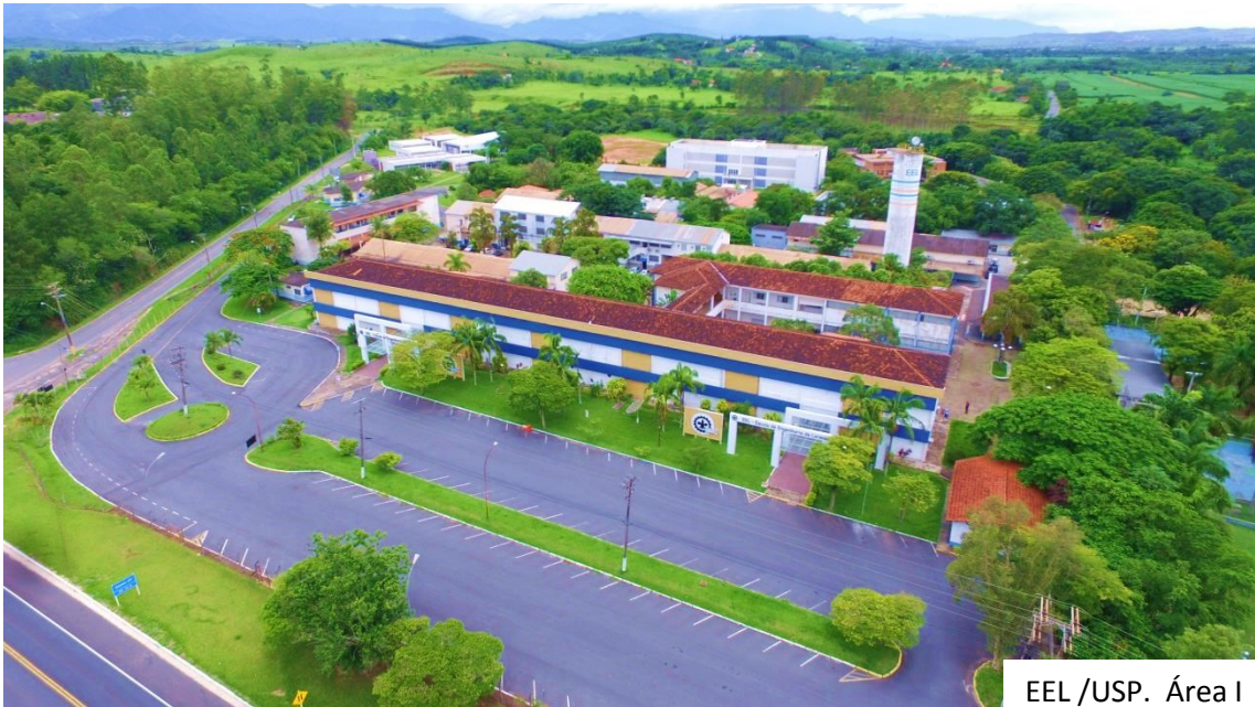
EEL /USP. Área I