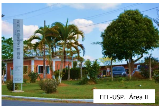
EEL-USP. Área II

Foi no dia 29 de maio de 2006, que o Decreto Estadual nº 50.839, extinguiu oficialmente a FAENQUIL e transferiu suas atividades de ensino, pesquisa e extensão para a Universidade de São Paulo. Desde então, os cursos de graduação, pós-graduação e todos os alunos da extinta FAENQUIL passaram fazer parte de uma das melhores e mais importantes Universidades da América Latina, a USP. Os servidores continuaram vinculados à SDE e passaram a prestar serviços à Universidade.