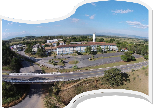
Área I: Estrada Municipal do Campinho s/nº (12)3159-5959